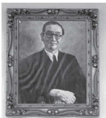
大邱大学校賀川豊彦記念館揭示 2016.4.14