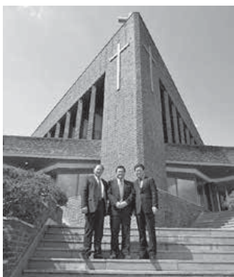
教会と幼稚園が併設 2016.4.14