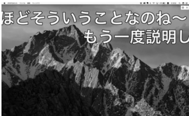
(図1) パパバコメントを教員のパソコン上で起動させた様子 (4)