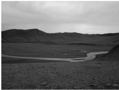
写真1 雄大な大地を流れるオルホン川