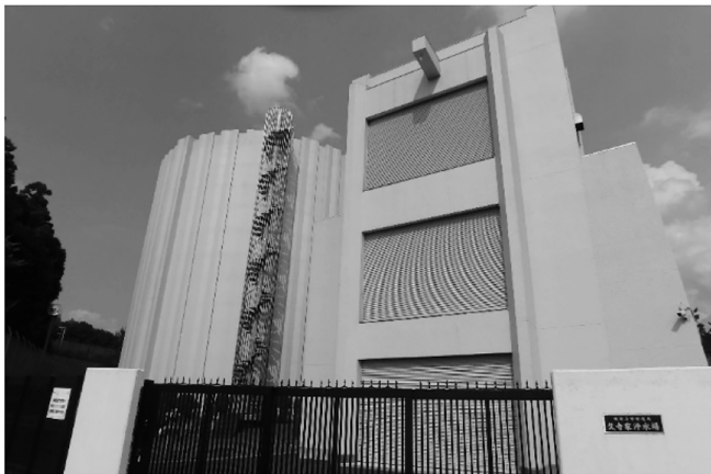
写真 1 我孫子市水道局久寺家浄水場 撮影：我孫子市水道局 2021 年 5 月 27 日

我孫子市の水道事業の沿革を瞥見すれば昭和 35 年（1960）年代以降に都市化が進み、工場や宅地開発によって、各家庭の井戸水の水質が悪化したことにより、市民から公営水道事業設置が要望され、昭和 41 年（1966）に創業事業の認可取得し、昭和 43 年（1968）10 月から給水が開始された。創