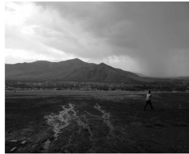
写真2 市内へ水を供給するガッチョルト水源地